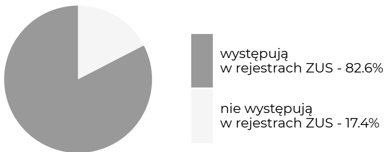
Absolwenci, którzy w okresie objętym badaniem ...