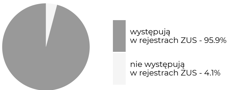
Absolwenci, którzy w okresie objętym badaniem ...