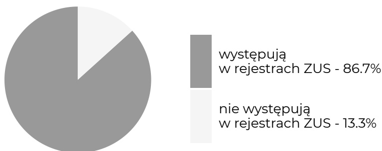
Absolwenci, którzy w okresie objętym badaniem ...