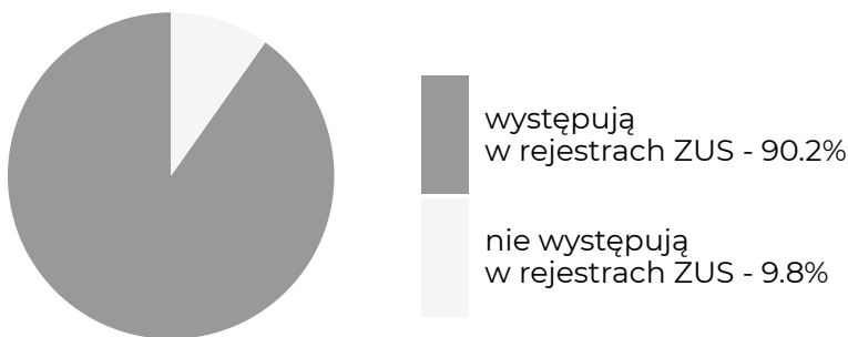
Absolwenci, którzy w okresie objętym badaniem ...