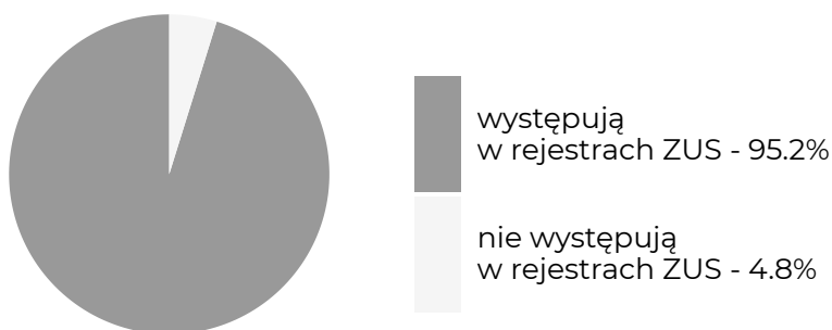
Absolwenci, którzy w okresie objętym badaniem ...